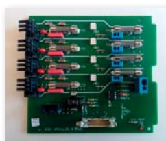
Carte puissance Modulo 4 (15A)